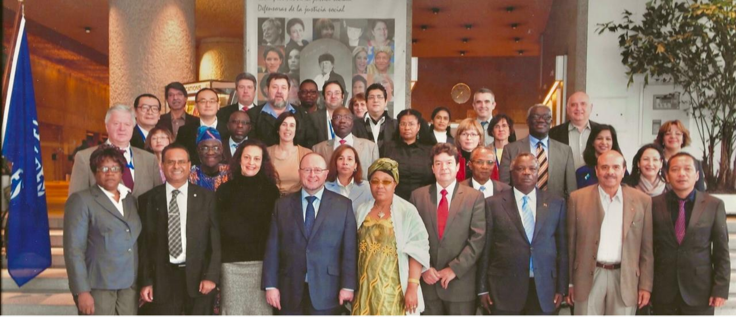
Le groupe des travailleurs du CA de l'OIT en 2011